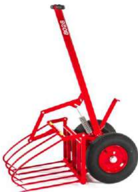
UM 8028 Hjulgrabb