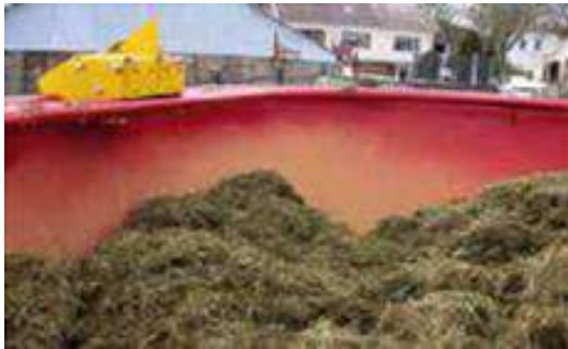
7853: Kniv for montering på blandevoغن