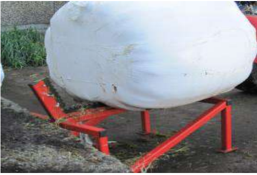
7852: Stasjonær kniv