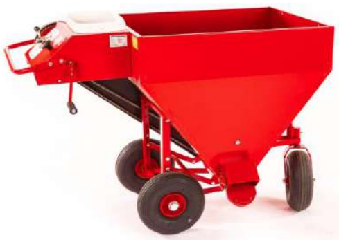
UM 8003 Kraftforvoغن med lufthjul